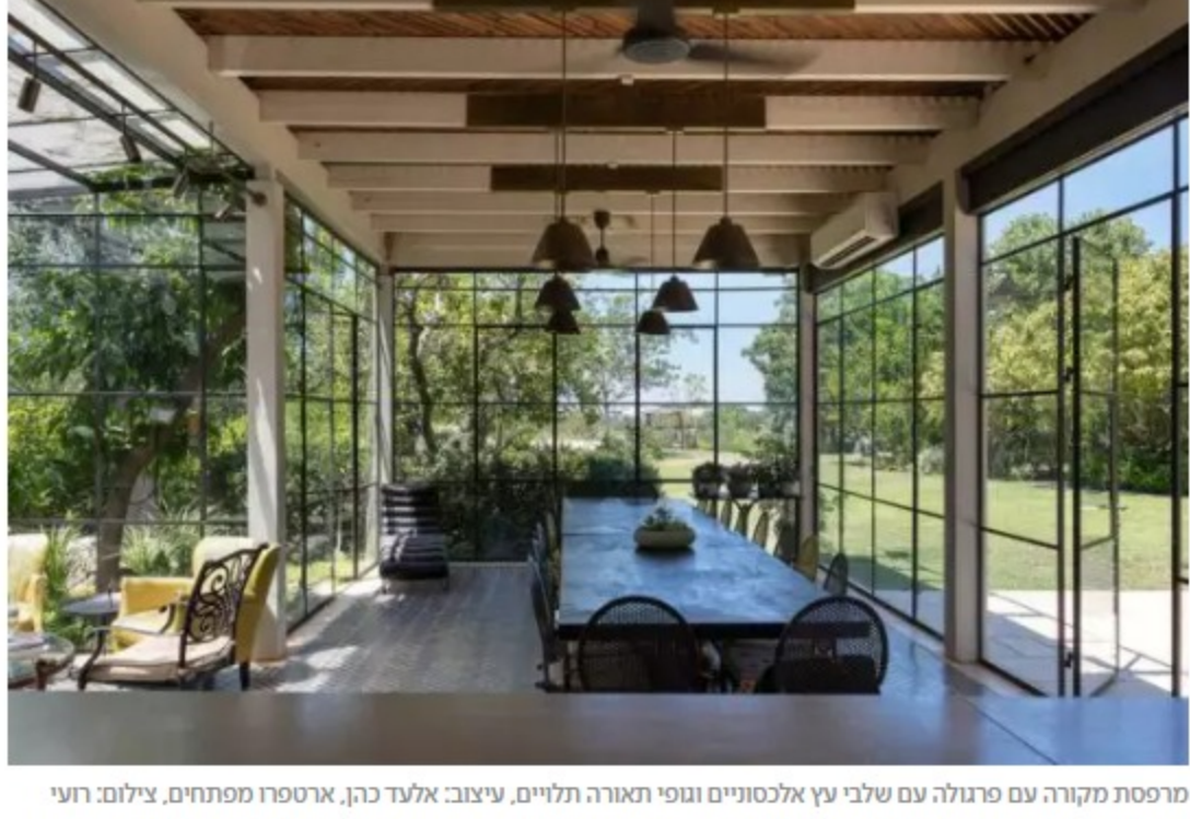
מרפסת מקורה עם פרגולה עם שלבי עץ אלכסוניים וגופי תאורה תלויים, עיצוב: אלעד כהן, ארטפירו מפתחים, צילום: רועי מזרחי

יש מרפסות שנסגרו עם קירות זכוכית ומה שמבדיל אותן, משאר החדרים בבית הוא הפרגולה. הפרגולה משאירה את החדר באוריינטציה של מרפסת מקורה.