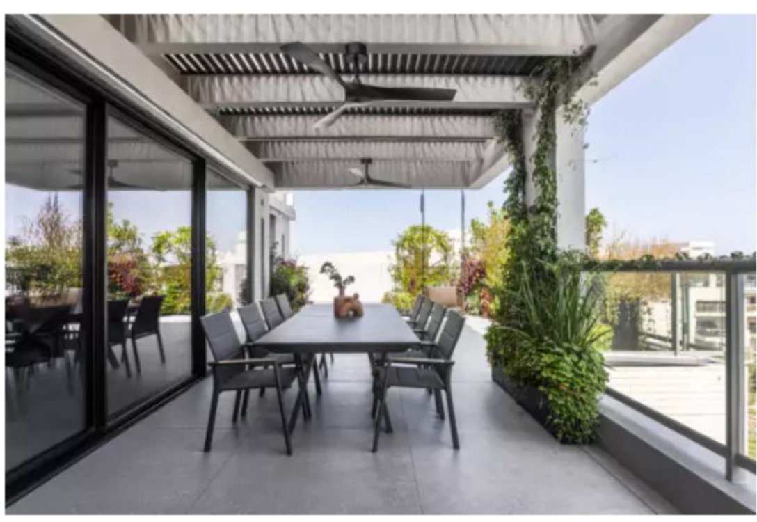
פרגולה מורכבת מקורות בטון ושלבי רפפה כהים, עוצב ע"י מעצב פנים תומר מזרחי, בוגר בית הספר לעיצוב של ברברה ברזין

הפרגולה מאפשרת ליהנות מהישיבה במרפסת כמעט כל ימות השנה, אפילו בימים של גשם קל. התקנה של גופי חימום או מאוררי תקרה, יאפשרו להקל ולאזן את תנאי מזג האוויר בימים של חום או קור.