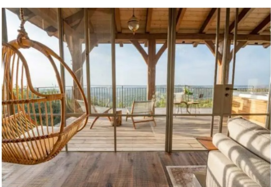
פרגולת עץ כפרית במראה אותנטי

טיפ חשוב בנושא תאורה – מי אמר שבפרגולה חייבים לשלב גופי תאורה פשוטים? אם תשלו בה גופי תאורה מעוצבים, כאלו שהייתם מוכנים לשלב גם בחללי הפנים, יתקבל מראה חמים וביתי, שיזמין בילוי מתמשך.