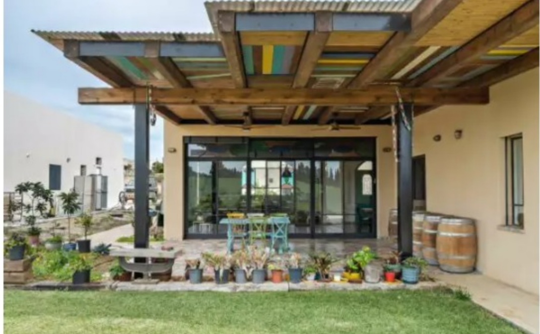
פרגולה מחתיכות עץ צבעוניות, תכנון שריתה רורן פלד, אקו דיזיין

פרגולות מעניינות נוספות הן אלו שעשויות מפיסות עץ צבעוניות, בדומה לפריטי ריהוט שעשויים מפיסות עץ של סירות דייגים שיצאו משימוש ופורקו.