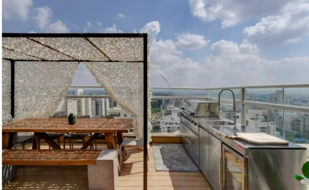
קונסטרוקציית ברזל עם רשת צל דקורטיבית, עיצוב פנים אייל טרסטר.

אפשר לומר שפרגולות הן התפתחות אבולוציונית של הסוכה. את הסוכה החלפנו בקירות בטון וגבס, והפרגולה הפכה להיות התזכורת לסוכה המסורתית, שמאפשרת לראות בין ענפי הסכך את השמים והכוכבים, אבל כזאת שמשרתת אותנו לאורך כל השנה.