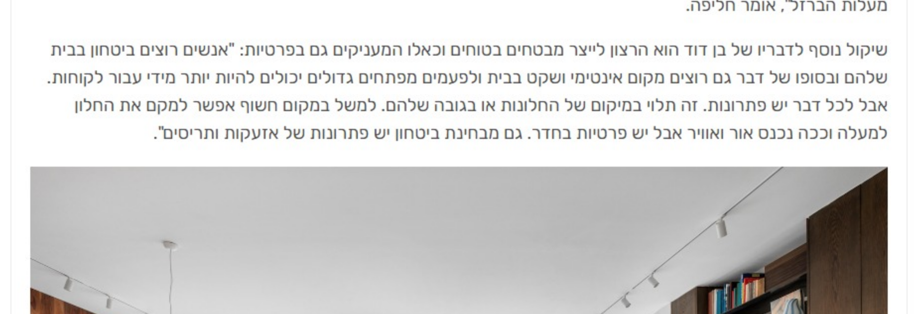
עיסוב קיהודן בן שי עלמת שירן נובל באיכות אוטונומי מפתח ברזל