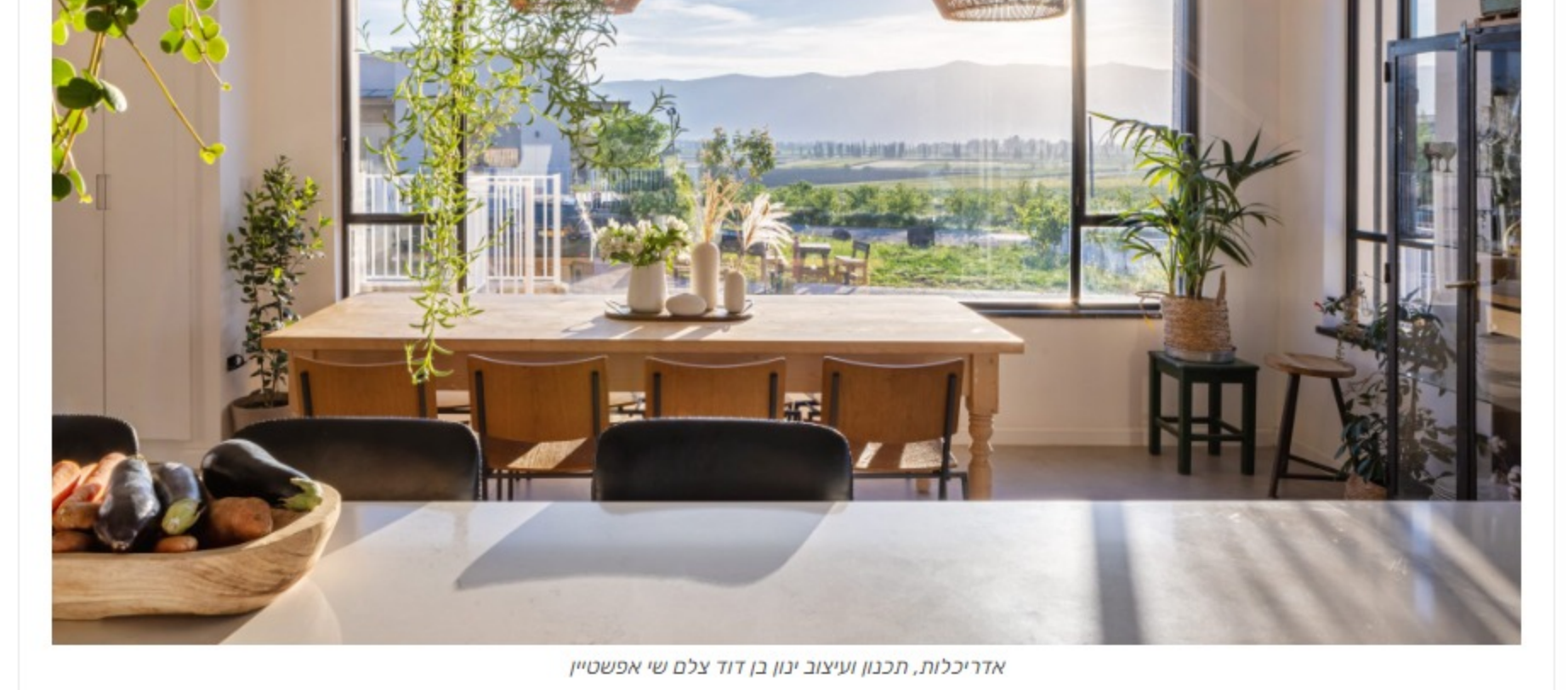
הכנסה ועיבוב קנבן דוד, עלום שי אפיאטיון

חליפה מסכימה ומסביר שבושפו של דבר ההשקעה משתלמת: "ככל שהמפתחים גדולים יותר ומשתלבים עם הגוף עם מינימום פגיעה בין כן עולה ערכו של הבית. הישראלים אוהבים אור בבית ומעדיפים בתים פתוחים ומאירים ככל האפשר". הוא מסביר ואף נהנה מדוגמה המאדיר הפרויקטים בהם לקח חלק בישוק קדומה. "לפני ארבע שנים בנינו מספר בתים בישוק קדומה וזכות המפתחים הגדולים והמאירים, הבתים נמכרו בעלות של מיליון ש"ח יותר מערכם בישוק".