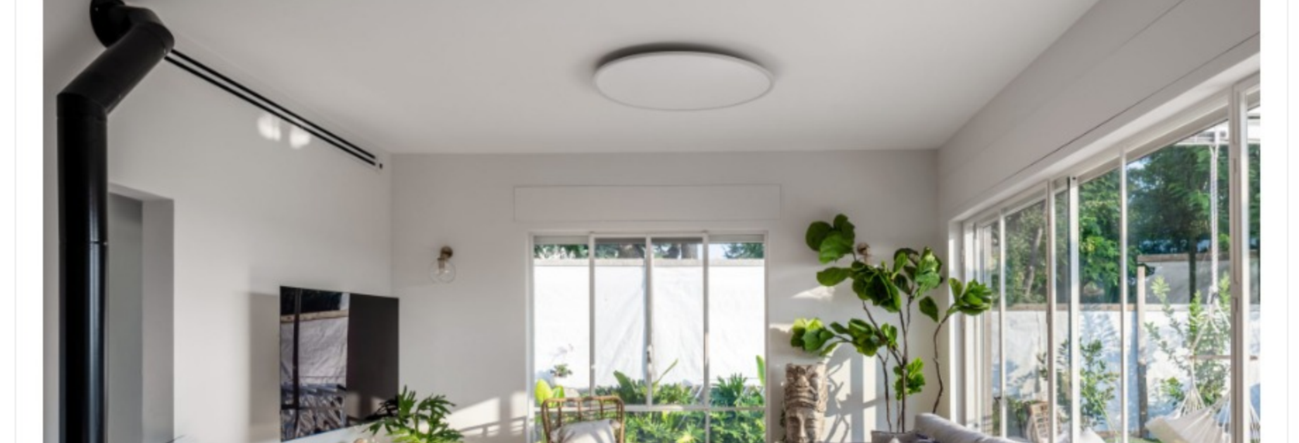
הכנסה ועיבוב קנבן דוד, עלום שי אפיאטיון

חליפה מסכימה ומסביר שבושפו של דבר ההשקעה משתלמת: "ככל שהמפתחים גדולים יותר ומשתלבים עם הגוף עם מינימום פגיעה בין כן עולה ערכו של הבית. הישראלים אוהבים אור בבית ומעדיפים בתים פתוחים ומאירים ככל האפשר". הוא מסביר ואף נהנה מדוגמה המאדיר הפרויקטים בהם לקח חלק בישוק קדומה. "לפני ארבע שנים בנינו מספר בתים בישוק קדומה וזכות המפתחים הגדולים והמאירים, הבתים נמכרו בעלות של מיליון ש"ח יותר מערכם בישוק".