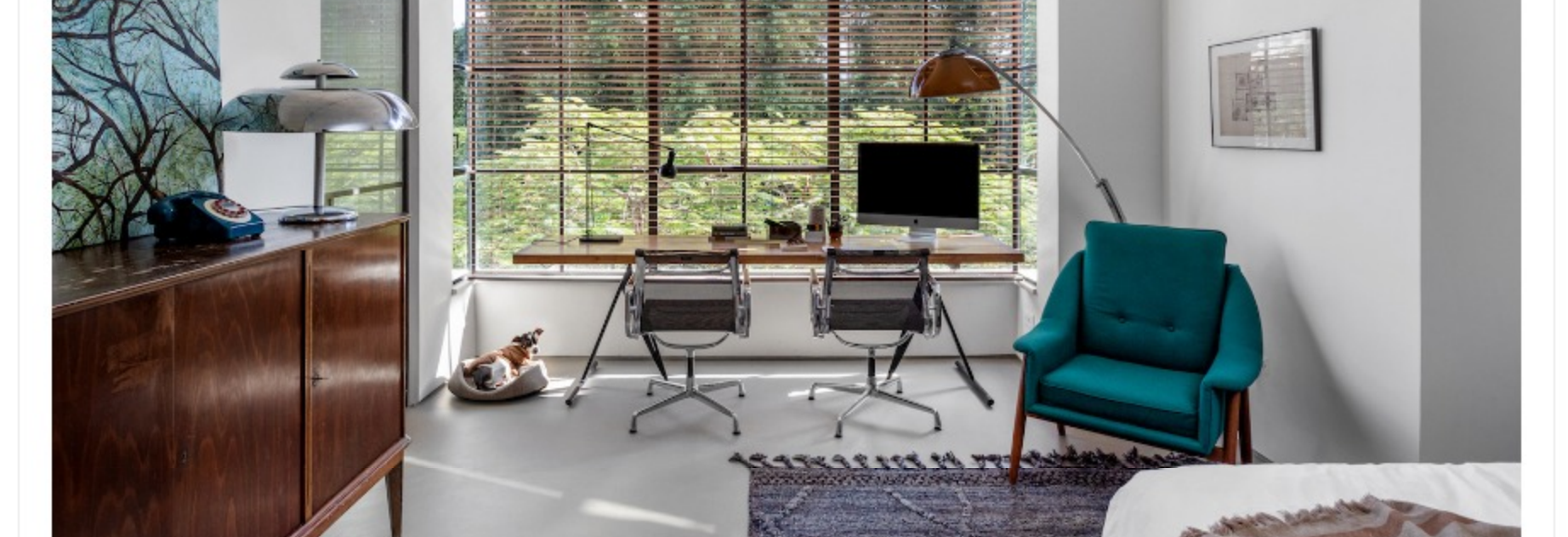
עיסוב קיהודן בן שי עלמת שירן נובל באיכות אוטונומי מפתח ברזל

היום ניתן לראות שהחוקות הישראלים משקיעים יותר במפתחים עצמם ולהערכתו של חליפה מדובר בעלייה של 25 אחוזים בהשקעה הכספית הכוללת את עיצובם, הכוננם וביניהם, מה שמשפיע על עלות המפתחים. מעבר לגודלם, הוא בחרת חומר הגלם לפרויקט ומחלק את המפתחים. שלרוב מיוצר מברזל או אלומיניום. לכל אחד מהמחומרים, יש יתרונות וחיסרונות וצריך לשקול כל אחד מהם בזמן התהליך והעיצוב. חליפה מסביר כי "ברזל הוא חומר נמוך דק, אך ע"ז זאת מאחד חזק, מה שמאפשר ייצור של מפתחים מאוד גדולים בעלי עיצוב מינימליסטי, עם כמה שחות חזקה של חוכוכית - מה שמתכתב עם המגמה העיצובית שרק הולכת ומתחזקת בעיצוב האחרונות של מפתחי גומכית גדולים, הרבים ומאירים ככל האפשר". בנוסף זהו חומר שניתן לבצע אותו בכל גבע ולכן כשאתנו מעצבים ללקוח, אנתנו משתמשים בצבעים שעוורים בחיבור בין חנים לחוץ ומתאימים לסגנון העיצובי של הפרויקט וכך תיווצר סירגורה הרמונית בין החללים. "עלמות הברזל", ממשיך ומסביר חליפה, "אלומיניום הוא חומר פחות חזק ושימוש במפתחים, הפרופיל שלהם יהיה עבה יותר לעומת ברזל, דבר שמוביל ליותר בולטות החומר ופחות תפוחות סטטשו הגבולות". ומה לגבי השוני בעלויות? "בעבר האלומיניום היה משמעותית הרבה יותר זול מברזל ולמעשה בהתחלה עלותו הייתה מתחמכת בחצי מעלות הברזל. ע"ז חשבונו בג"ז ששי האלומיניום התפתחה והיא ספיקת פתרונות יותר זול ו-80 אחטמיים למפתחים גדולים, וכך לאט לאט העלות בין שני החומרים הצטמצמו. כיום עלות האלומיניום עומדת על 70-80 אחוז מעלות הברזל, ואומר חליפה.