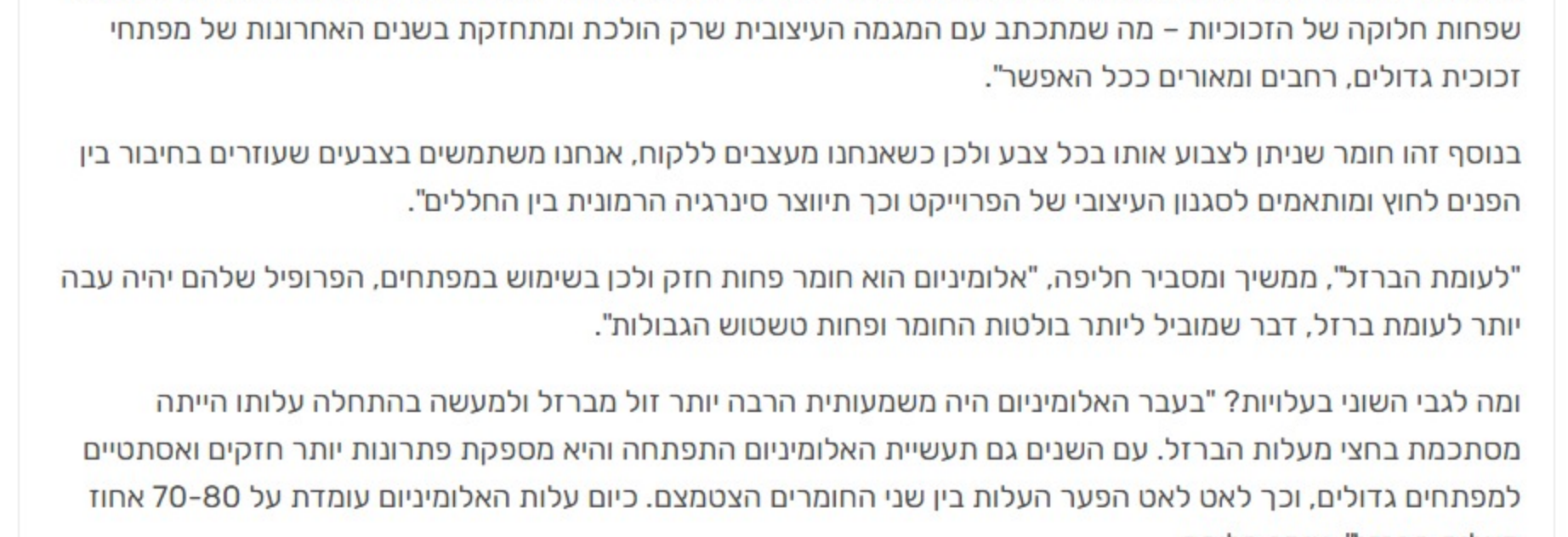
עיסוב קיהודן בן שי עלמת שירן נובל באיכות אוטונומי מפתח ברזל

שקולו נוסף לדבריו של בן דוד הוא הקונס וקציב מנסטים ובטוחים וכלוא המעניקים גם בפריסיות: "אנשים רוצים ביסוחון בבית בייקול ובסופו של דבר גם רוצים אינטימי וקטנים בבית ולפעמים מפתחים גדולים יכולים להיות יותר מידי עבור לקוחות. אבל לכל דבר יש פתרונות. זה תלוי בפיקוס של החלונות או בגובה שלהם. למשל במקום חשוף אפשר למקם את הלחון למעלה וככה נכנס אור ואוויר אבל יש פריסיות בחדר. גם מבחינת ביסוחון יש פתרונות של אוזקות ותריסים".