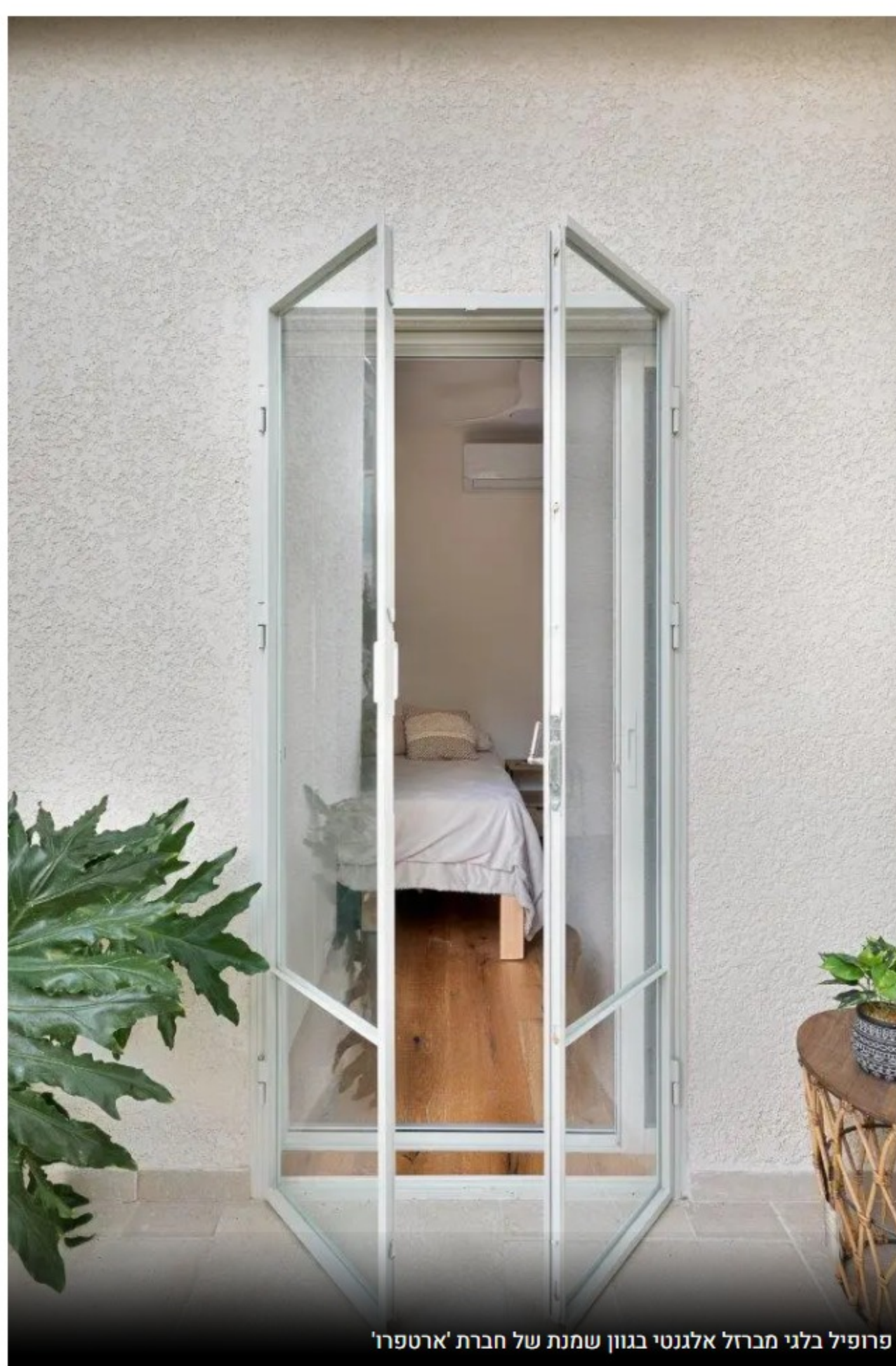
פרופיל בלני מברזל אלגנטי בגוון שמת של חברת 'ארטפור'

דגש מיוחד ניתן למפתחים, על מנת להכניס את הצמיחה והנוף האורבני שבחוף. בפרט ניתן דגש לוויטרייה בסלון, שם הוחלף הפרופיל הכהה והמונוס לפרופיל בלני מברזל אלגנטי בגוון שמת של חברת 'ארטפור' שמתמחים בתחום. כך נוצר קשר כמעט בלתי אמצעי בין החלל הציבורי למרפסת ולמראות מבחוץ. הוויטרייה הגדולה ששנתה לפרופיל דק ובהיר שינתה מקצה לקצה את האווירה של החלל הציבורי. למרפסת עצמה יש יציאה מהסלון, חדר השינה של ההורים ומחדרו של הבן. מערכת הישיבה עברה ריענון וזופדה מחדש. הפסתה, זו למרכז הסלון והוא מהווה אלמנט דומיננטי בהוואי המשפחתי.