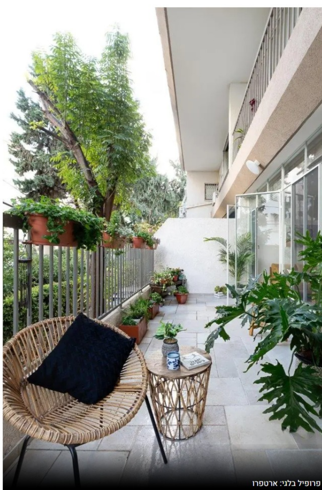
פרופיל בלני: ארטפור