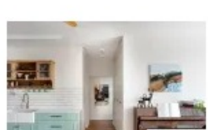
כשהמוזיקה היא הנשמה של המשפחה / אביבית אבורוס