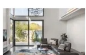
בית עם פתיחות ואוויריות / אדריכלית מרינה רכטר-רובינשטיין