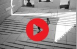
אדריכלות מעצבת לאנשים עם מוגבלות